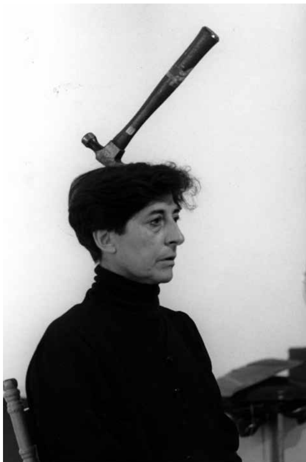
Esther Ferrer. Las cosas . Performance. Festival Le Lieu, Québec (Canadá), 1990. © Esther Ferrer, VEGAP, Bilbao, 2017.