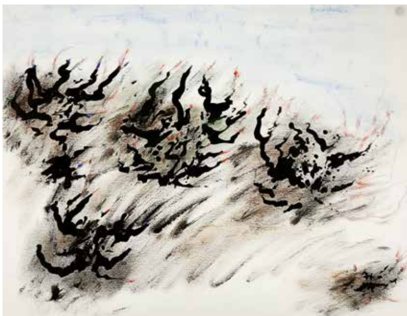
Henri Michaux Sin título , 1981 Acrílico, tinta china y lápiz sobre papel 500 x 650 mm Colección particular

2 DE FEBRERO–13 DE MAYO, 2018 SALAS 305, 306 Y 307 COMISARIO: MANUEL CIRAUQUI